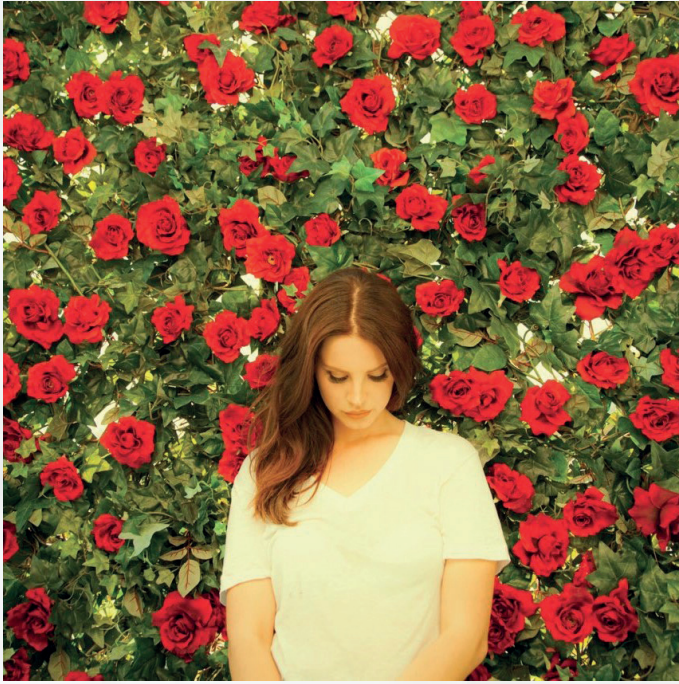
Lana Del Rey, "Ultraviolence" (2014)

Uno de los rasgos más importantes de la cantante es su personalidad indiferente, que puede ser su victoria más significativa como una mujer tan famosa; logra despertar simpatía a pesar de que aparenta ser una persona que no simpatiza con nada. Lana Del Rey ha llegado a un nivel que pocos músicos alcanzan pero muchos reverencian: es famosa, pero no tanto como para no poder vivir su vida, pero tampoco es una desconocida en el sentido de que a nadie le importan tanto sus palabras. Al contrario, sus comentarios ya han despertado muchas polémicas, pero nunca las suficientes como para que parezca sacudir su estructura con quienes gustan tanto de su forma inusual.