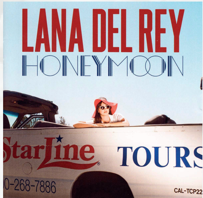
Lana Del Rey, "Honeymoon" (2015)

Usar la palabra 'innecesario' para definir una obra de arte es algo complicado, con un poco de empatía ya es posible imaginarse cuánto tiempo lleva un proyecto y tanta gente para hacerlo, pero frente a un disco que parece no serlo. algo que necesitamos, sigue siendo una lucha mental para tratar de driblar una definición que tenga tanto sentido. Disfrutar de Honeymoon de principio a fin es una carga, y si el oyente decide hacerlo en el orden impuesto en la lista de canciones, la experiencia puede ser como una batalla con un arma sónica.