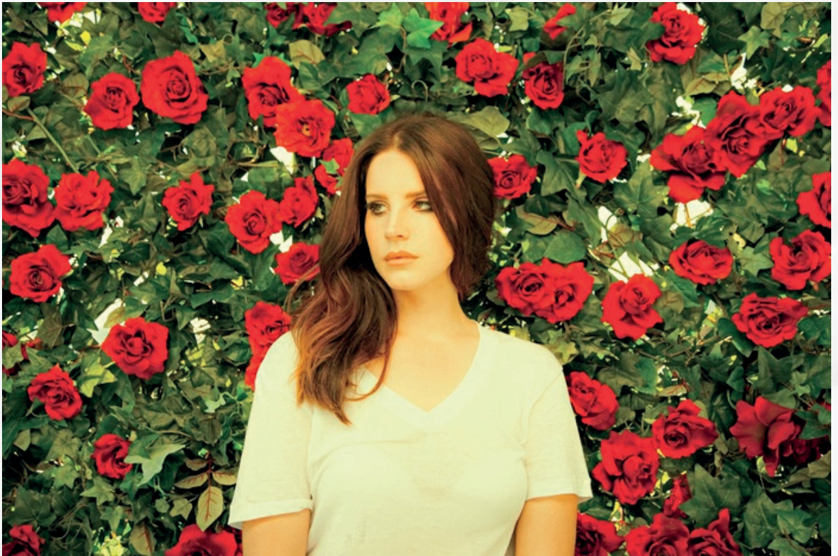
Lana Del Rey, "Ultraviolence" (2014)

Uno de los rasgos más importantes de la cantante es su personalidad indiferente, que puede ser su victoria más significativa como una mujer tan famosa; logra despertar simpatía a pesar de que aparenta ser una persona que no simpatiza con nada. Lana Del Rey ha llegado a un nivel que pocos músicos alcanzan pero muchos reverencian: es famosa, pero no tanto como para no poder vivir su vida, pero tampoco es una desconocida en el sentido de que a nadie le importan tanto sus palabras. Al contrario, sus comentarios ya han despertado muchas polémicas, pero nunca las suficientes como para que parezca sacudir su estructura con quienes gustan tanto de su forma inusual.